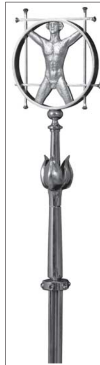
Dokončení na str. 7

Další rozvoj fakulty je závislý na vytváření optimálních podmínek pro práci studentů všech studijních oborů a jejich budoucí působení v profesích fyzioterapeutů, učitelů, tre-