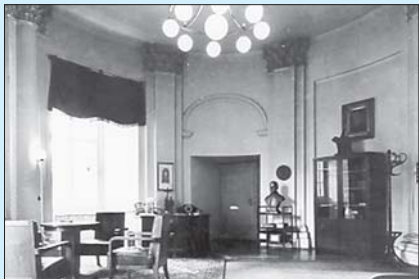
▲ Pracovna děkana CMBF na sklonku 40. let minulého století

V Olomouci zůstala pouze samostatná teologická fakulta (až do uzavření českých vysokých škol nacisty v listopadu 1939) a dočasně (do studijního roku 1873–1874) medicínsko-chirurgické studium. Historická žezla Františkovy univerzity byla předána k užívání Leopoldově a Františkově univerzitě v Innsbrucku, jež roku 1998 věnovala Univerzitě Palackého kopii rektorského žezla staré olomoucké univerzity.