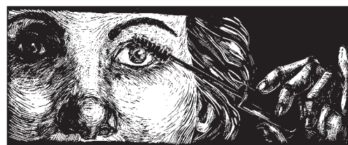
▲ Linoryt V. Psoťkové

■ Autoportrét je věčné téma: nabízí se nejen, schází-li model, objekt ztvárnění, ale je dobré především jako záminka k sebereflexi, k pře- myšlení. Zatímco náš pohled do zrcadla je banální, každodenní, snadný, – linoryt je obtíž- ná rytecká technika, která ono „přemyšlení o sobě“ nijak neulehčuje. Výsledky tohoto ne- usnadněného přemyšlení o sobě, tohoto „sebe- rytí“ provedeného v technice linorytu, černobí- lého nebo barevného, představuje výstava s náz- vem „Seberty“, instalovaná v těchto dnech v Uměleckém centru UP. Předkládá studentské práce, jež vznikly během několika minulých let v ateliéru grafiky Katedry výtvarné výchovy PoF UP na základě zadání tohoto tématu v seminářích Grafika 1.