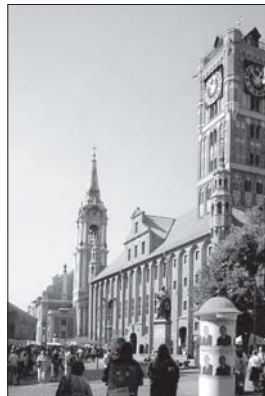
▲ Toruňská radnice s kostelem sv. Ducha v pozadí

Také další plenární a semiplenární přednášky spadaly do oblasti sociální stratifikace. Do tohoto klíčového sociologického oboru právě zkoumání sociálních nerovností patří. G. Therborn (Uppsala University) parafrázoval téma konference, když je přirovnal k novému promyšlení svého více než třicetiletého manželství. Copak se sociologové někdy přestali nerovnostmi zabývat, jaképak „znovu“? Polský výzkumník H. Domański na polských datech testoval řadu hypotéz týkajících se příjmových nerovností, meritokracie, reprodukce vzdělanostních nerovností, mezigenerační mobility atp. Nejzajímavější byly změny některých trendů, jež si vyžadují nová vysvětlení. Například k neočekávanému poklesu vzdělanostních nerovností v Polsku zřejmě v poslední době přispěl vznik řady soukromých vysokých škol, které však nemusí vždy nabízet srovnatelnou úroveň vzdělání. Zdá se, že také Polsko čeká inflace vzdělání a „nemoc diplomů“. Další z Poláků, A. Rychard, se v příspěvku ptal po osudech hnutí Solidarita, jejíž vývoj stále nepovažuje za ukončený. Zdaleka ne všechny části Solidarity lze označit za