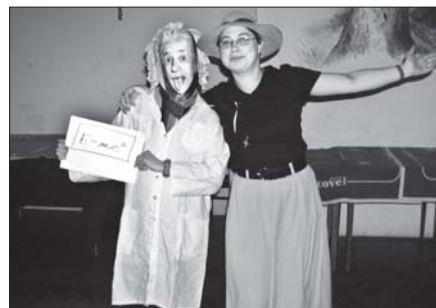
▲ Svůj první maškarní bál uspořádala na počátku května Vysokoškolské katolické hnutí. V olomoucké restauraci U Pelikána se k veselivému rejší sešlo kolem padesáti rozmanitých masek, některé velmi nápadité. -red-

Mgr. L. Melková, Katedra českého jazyka a literatury PdF UP