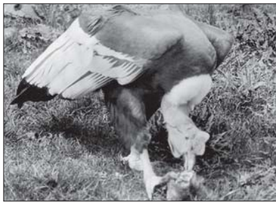
▲ Samec kondora velkého

Zaprvé, všichni kondori jsou převážně mršinožravci, představují v Americe protějšek supů Starého světa. Jen část jejich potravu tvoří menší živočichové, mláďata apod. Budiž, malý Robert byl momentálně v bezvědomí po pádu se skály, a mohl tedy hrát roli mršiny. Horší by to bylo s otázkou jeho transportu. Ornitolog by nám řekl, že dravci jsou schopni v letu unést břemeno asi do hmotnosti svého vlastního těla. A dodal by, že dotyčný kondor velký, Vultur gryphus, dorůstá do hmotnosti asi 11 kg, při rozpětí křídel okolo tří metrů. To ovšem poněkud neladí s výše popsanými údaji pana Vernea. A tak si kondor musí odpustit sražení byků do propasti, i kdyby náhodou ve svém revíru potkal nějakého takového mimořádného hovzího alpinistu!