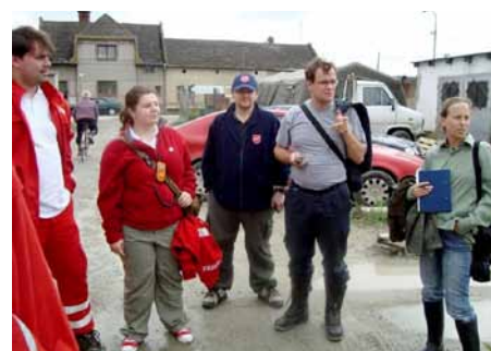
Koordinace týmu provádějící psychosociální šetření v terénu