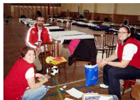
Evakuační středisko Tovačov – členky Pomáháme pomáhat připravující aktivity pro evakuované děti