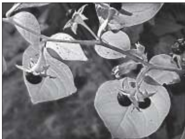
▲ Atropa acumanita (rulik)

sloužily velmi praktickým cílům a potřebám. Jako klášterní zahrady byly významným zdrojem léčiv a místem působení mnišů-léčitelů (v soukromých zahradách panovníckých rodů však i řemeslných travářů), v podobě introdukčních zahrad v Evropě i v nově objeveném zámoří fungovaly jako centra pro výzkum a domestikaci nových užitkových plodin a dřevin. Jako univerzitní zahrady a arboreta poskytovaly svými živými sbírkami i herbárii pohotový přístup k rostlinným druhům nejen studentům, ale také přírodovědcům, zahradníkům a lesníkům. Ve 20. století se botanické – stejně jako zoologické – zahrady otevřely veřejnosti a hlavním kritériem se stala atraktivita a jedinečnost jejich kolekcí. Botanika má však i dnes překvapivě mnoho podob, jež patří ke všednímu dni, a přesto zaujmou. To bezpochyby platí i o poslání současných botanických zahrad, které jsou ve světě neodmyslitelnou součástí všech významných univerzit a tvoří jedno z nejvýznamnějších pojetek mezi vědci, odborníky a širokou veřejností.