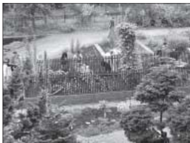
▲ Rizikové rostliny

Při příležitosti letní části zahradnické výstavy FLORA OLOMOUC, která se konala ve dnech 19.–22. srpna 2004, otevřela Katedra botaniky PíF UP v Botanické zahradě, kterou spravuje, novou expozici na téma Rizikové rostliny v životním prostředí . Tato akce je v mnoha ohledech předznamenáním nové cesty, na kterou chce univerzitní Botanická zahrada vykročit v 21. století. Zahrada, která má již za sebou více než 100 let existence, nikdy nebyla veřejnosti uzavřena, avšak jen málo olomouckých občanů vědělo, kde se vlastně nachází, a obáváme se, že ani mnoho studentů Univerzity Palackého její sbírky ke studiu nevyužilo. Dlouhá léta zůstávala jen malým tichým zákoutím se starými stromy, s přebujelými i prosychajícími keři, s rázovitým zahradním domkem, se záhony plnými málo čitelných jmenovek a více či méně náhodně rozmístěných rostlinných druhů často unikátní hodnoty na samotném okraji rušného městského centra. Jen její dlouholetí příznivci se v časném jare přicházeli potěšit tisíci rozkvetlých talovinů, se sněženkami, bledulemi, ladoňkami a kandiky, jež si během dlouhých desetiletí našly v parkové části svá přirozená stanoviště. Tato jarní krásy však rychle pomine a zahrada na výsušném šterkovém podloží začíná každoročně trápit sucho, nedostatek závlahové vody a věčný zápas s druhy rostlin, které „unikají ze zajetí“.