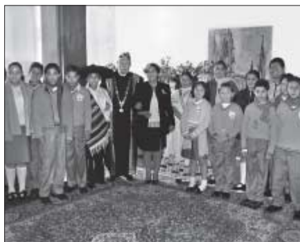
▲ Zhruba dvacetičlenná skupina žáků a učitelů milionové čtvrti Lidice hlavního města Mexika Mexiko City, navštívila 23. 9. Pedagogickou fakultu UP.

Zmíněná část hlavního města Mexika přijala pojmenování Lidice v době heydrichiády, a to jako důkaz soucitění s okupovaným Československem. Nejenže místní lidé památku Lidic dodnes velmi ctí – na lidické náměstí vyzdobeném monumentální freskou se pravidelně odehrávají vzpomínkové akty – v této oblasti je i pěstována česká kultura.