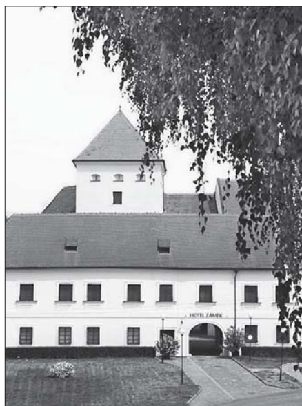
▲ Zámek v Čejkovicích, v letech 1624–1773 rezidence olomoucké koleje TJ; nynější stav objektu je výsledkem dlouhodobé a nákladné rekonstrukce, ukončené v roce 1998, kdy byl v objektu zahájen provoz hotelu Zámek Čejkovice (viz www.cejkovice.cz )