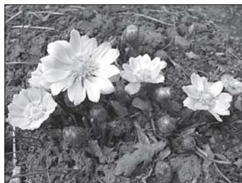
▲ Hlaváček jarní

Pod tímto názvem nabízí od 21. do 24. 4. Botanická zahrada PFF UP expozice tematicky zaměřené na jarní flóru a aktualizované podle průběhu vegetace.