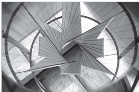
▲ Detail dostavby chrámu La Sayrada familia podle návrhu A. Gaudiho