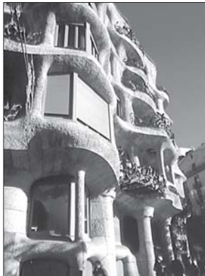
▲ Dům La Pedrera (Milá), Barcelona