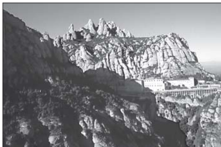
▲ Klášter Montserrat

Ptala se V. Mazochová