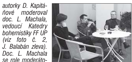
▲ Foto č. 3