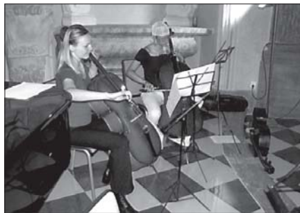
Hejčinských hudebních slavností již v neděli 30. 5. 2004 v 10 hod. v chrámu sv. Cyrila a Metoděje.