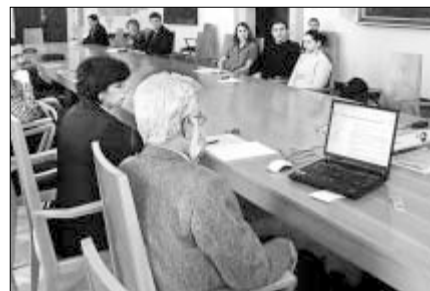
▲ O reformě financování ubytování hovořili studenti také na nadávném setkání s rektorkou UP

výsledném navýšení ceny v menze považují reformu za sociálně neúnosnou.