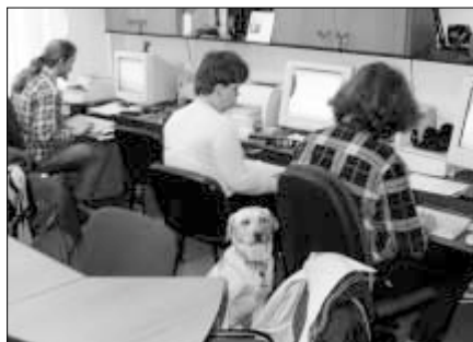
▲ Ilustrační foto z Centra pomoci handicapovaným.

Služby Centra pomoci handicapovaným PdF UP (dále jen Centra) jsou ojedinělé svou šíří. Na rozdíl od obdobných středisek jiných vysokých škol zprostředkovává Centrum PdF UP poradenskou pomoc všem kategoriím postižených a poskytuje konkrétní služby speciálně pedagogického zaměření všem handicapovaným studentům z řad posluchačů UP a uchazečů o vysokoškolské studium na fakultách UP. Než se budeme věnovat konkrétní nabídce služeb, můžete krátce zmínit historii Centra?