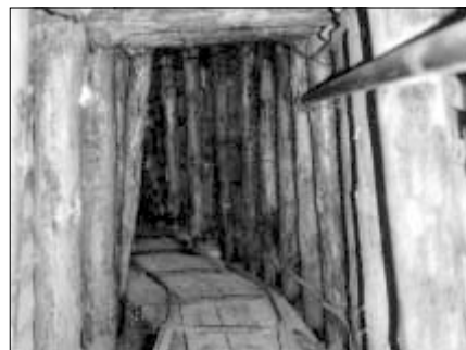
▲ Tunel v Sarajevu (zásobování během obléhání)