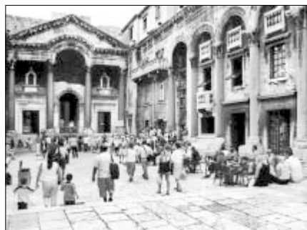
▲ Split – Diokleciánův palác

Nepřijala. Pokračujeme podle stanoveného plánu. Split – den plný antické a středověké minulosti, mohutných staveb, těžce placených vstupů do každých dveří v Diokleciánově paláci a nebezpečných holubů v parku.