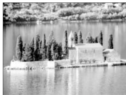
▲ Boka Kotorská

kdy se otvírá, zde uložená, rakev s ostatky místního vojvody. Vtom se nás ujímá jeden z mnichů. Vyzáruje z něj klid a mír. Provází nás po kláštere a místním muzeu. Setkáváme se zde také s mladým bratrem, který vyrazil z Čech a procesoval celý Balkán, aby zde zakotvil, už asi napořád. Ani se nedivíme, Černá Hora je krásná.