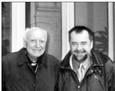
▲ S kardinálem T. Špidlíkem, S. J. v Římě, listopad 2003.

S prof. T. Špidlíkem jsem se setkal na začátku devadesátých let a bylo to pro mne do značné míry určující setkání. Velmi mně ovlivnil a stali se z nás přátelé. Když potom otec Špidlík přijel do Olomouce na teologickou fakultu, při setkáních jsme diskutovali i o tom, co nás z hlediska našich bádání vlastně může spojit. A dostali jsme se k těm úplně nejzákladnějším kategoriím, nebo spíše transcendentáliím. Za prvé nás zásadně zajímala otázka času, času a věčnosti, a tehdy jsme se dohodli, že sepišeme – spíše populární formou – jakési paralely – z pohledu teologa a z pohledu přírodovědce. Nakonec jsme to udělali tak, že jsme vše provázali. Chtěli jsme původně sepsat celý triptych, ale zůstalo u dítychu – první článek měl