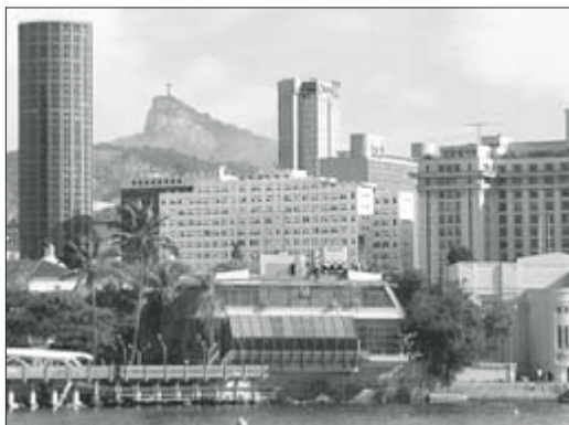
▲ Pohled ke Corcovadu, Rio de Janeiro, Brazílie