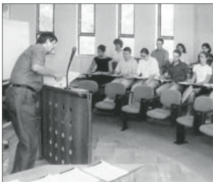
o problematice evropského spotřebního a pracovního práva a o otázkách evropského právního studia.

V následujících dnech se symposium přesunulo do Rotundy PF UP, kde účastníci letní školy diskutovali o aktuálních politických a institucionálních otázkách evropské integrace, o evropské agrární politice,