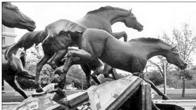
▲ Sbohem, betonová ohrádka s jistou otypkou sena, vítěj, svoboda s nádhrou volnosti i s každodenním úsilím o přežití! Poznáváme se? (Pád Berlinské zdi, sousedí před George Bush Library, Texas A&M University, College Station.)

Zdejší univerzitu ale asi nejvíce charakterizují tradice studentského života. Být „Aggie“, tedy student školy s „agricultural“ ve svém někdejší názvu,