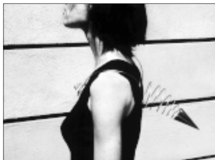
▲ L. Pavězková: „Provokace“, náhrdelník, zinek, 2002.