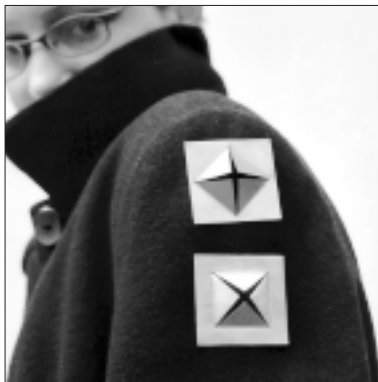
▲ L. Pavězková: „Prolamované brože“, měď, 2002.

Mgr. J. Dürr (FF UP): Regionální a strukturální politika EU. Seminář (součást tzv. Školy EU). Velká zasedací místnost bývalého olomouckého okresního úřadu (5. patro), tř. Kosmonautů 10, od 15 hod.