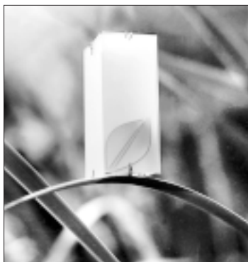
▲ K. Jančářová: „Rosa“, brož, umělá hmota, 2002.