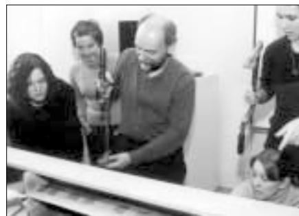
▲ V rámci programu Socrates-Erasmus se ve dnech 3.–4. 3. na Katedře hudební výchovy PdF UP v Uměleckém centru UP uskutečnil workshop s názvem Stavba Aiolovy harfy , který vedl doc. P. Tehaef z Institutu církevní hudby a hudební vědy při Ernst-Moritz-Armdt Universität v Greifswaldu.