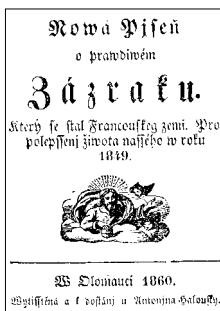
▲ Titulní strany kramářských tisků (19. stol.)

Druhý koníček má již blízko k mému oboru. V době, kdy jsem absolvoval Filozofickou fakultu UP, se v Olomouci rozvíjelo bádání v oblasti pololidové literatury, především tištěných knížek lidového čtení a hlavně kramářských písní, šířených zvláště během 18. a 19. století. Zapojil jsem se do tohoto výzkumu a to byl základ pro vznik mé sbírky kramářských písní. Kramářské písně jsou speci- fická záležitost, jedná se o texty duchovní i světské, kam náležejí i tzv. skladby novinové, zpravodajské, neboť i publicistické texty byly v zájmu větší atraktiv- ty a snažší percepcí veršovány. Rozvoj kramářských tisků se datuje po roce 1774, kdy byla zavedena povinná školní docházka a kdy vznikl nesmírný hlad po tištěném slově. Čtyř- až osmistránkové drobné tisky se prodávaly obvykle za dva krejčary (což byla tržní cena jednoho vejce), takže si je mohly dovolit kupovat i nejhudší vrstvy. Produkce těchto tisků byla obrovská, živila se jí řada venkovských tiskáren. Nejpčetnější byly modlitbičky a písně poutní, světských písní se vydávalo podstatně méně. Tisky byly zpravidla zdobeny dřevorezem. Na rozdíl od formálně i obsahově vybroušených písní lidových jsou kramářské písně mnohdy neobratné, přehnaně pate-