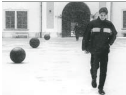
▲ Letní semestr byl sice na většině fakult zahájen, sněhu a mrazu však tím nebylo – ani na nádvoří Brojnice.