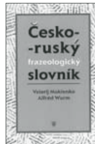
▲ Mokjienko, V., Wurm, A.: Cesko-ruský frazeologický slovník , VUP 2002, 1. vydání, 659 stran

V prosinci se uskutečnilo na půdě VUP již tradiční setkání s autory. Zde bych ráda poznamenala, že jsou zvaní vždy ti, kteří v průběhu roku využili našich služeb a publikovali ve VUP. Pravidelně je toto setkání spojeno s výstavou celoroční produkce vydavatelství, pro zájemce je uskutečněna prohlídka prostor celého vydavatelství. Pozornost budil dvoubarvý ofsetový tiskářský stroj (zn. Heidelberg), který má vydavatelství v provozu od září loňského roku.