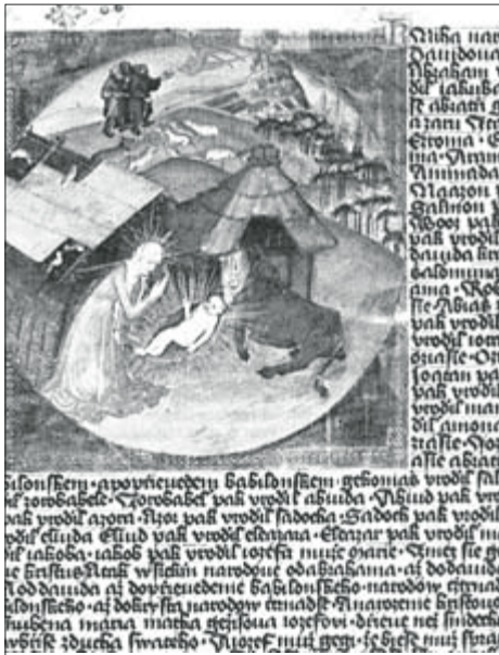
▲ Bible boskovická (po r. 1415): Adorace Děcka