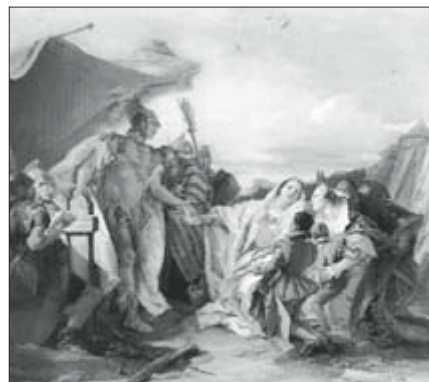
▲ Obr. 4

zároveň už se ochotně obrací ke své prosící rodině – v olomouckém obraze se proto spíše ještě rozhoduje. Srovnajme dále pojednání Koriolánova příběhu ve slavném díle Tiepolové (obr. 4), závěsném obraze