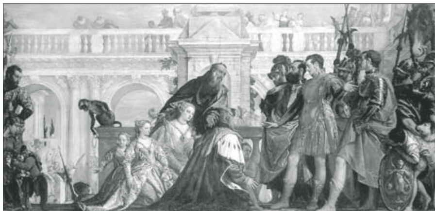
▲ Obr. 2

snadno zaměněno s jiným příkladem velkomyslnosti, Koriolán před branami Říma. Snad měl divák osmnáctého století mnohem lepší oko pro rozdíly mezi oběma tématy, než máme my, ale faktem zůstává, že i pro školence odborníka v ikonografii není vždy snadné dešifrovat, které z obou je ukazováno.“