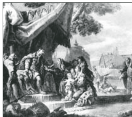
▲ Obr. 3

prezentovanou pointu, dramatický vrchol: Dareiova matka Sisygambis omylem zamění Alexandra za jeho velmi podobného druha Hefaistona, před ním se chtěla pokorit, je upozorněna na svůj omyl okolostojícím komparesem a pokleká před pravým Alexandrem. Ten ji utěší, že se tolik nezmylíla, ukáže na Hefaistona s tím, že „i ten je Alexandrem“, tj. ve stejném řádu hodnocení hrdinských zásluh. Tento motiv v ol-