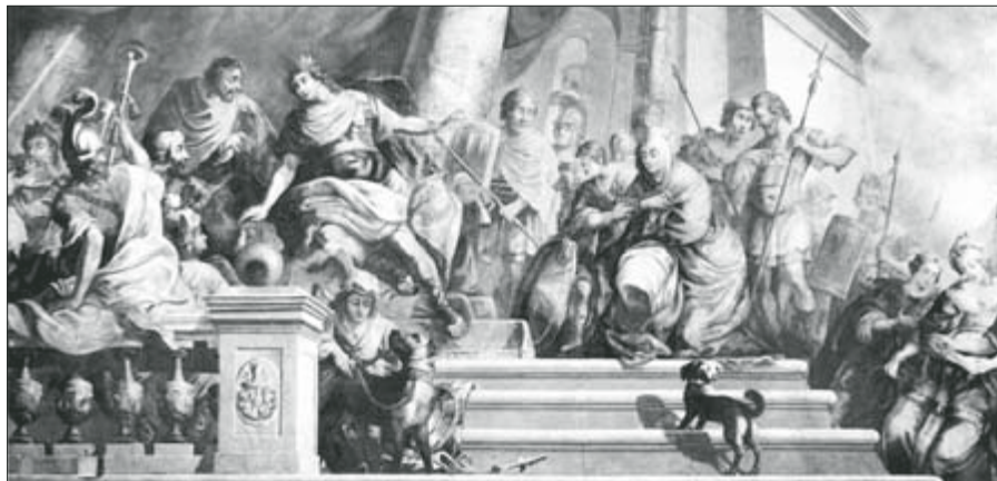
▲ Obr. 1