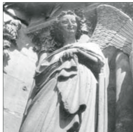
Socha směřující se anděla (Vézelay)

Už ani nevíme jak, ale najednou nás někdo popostrčil přímo doprostřed dění a my jsme se na něm sami začali podílet. Každé ráno, každý den vždy stejné úkony a procesy, a přitom vše vždy tak jiné, nové! Vstávat – někdy hodně brzy, sbalit stany, nasedat do autobusu, směr: katedrála nebo opatství. Každá památka nás přivítala vždy důkladně připravené – vždyť jsme si po cestě vyslechli mnohdy velmi zdařilé referáty, které nás upozornily na to, jakých pozoruhodností si máme určitě všimnout, kam si danou stavbu zařadit, aby nás jen tak neminula jako další položka v seznamu. Tak jsme se naučili vnímat symboliku románského stavitelství a zejména nám utkvěly v paměti neopakovatelné tvary hlavic románských sloupů a nádherné plastiky dveřních portálů. Poznali jsme, jakými znaky se od sebe liší gotika vrcholná a pozdní, jakých ozdob využívala paprsková