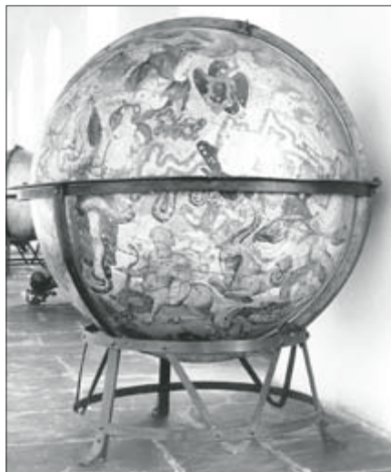
Vzácná učební pomůcka staré olomoucké univerzity – nebeský glóbus z roku 1696

iuventutis.“ 4 Dokonce je také napomíná zpovědník: „Vstaň!“, ale student si postaví hlavu a myslí si: „U mne neznamená „Surge“ vstaň, ale zůstaň ležet a běhej dále ve svém lajdáckém životě za šermová-