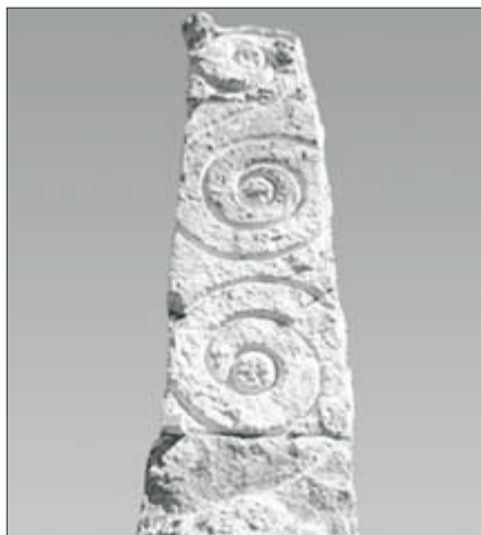
Kamenný sloup, umístěný u „Keltské svatyně“ u Luďčova (0,8×0,6×3,6 m, travertín), 2001.

Studium mi dalo docela dost. Výborný kolektiv, příjemná byla atmosféra tehdejšího Zlína, zejména hospodská. V roce pádu totality jsem ještě absolvoval tříměsíční studijní pobyt v Itálii... Ve škole jsem se naučil řemeslo.