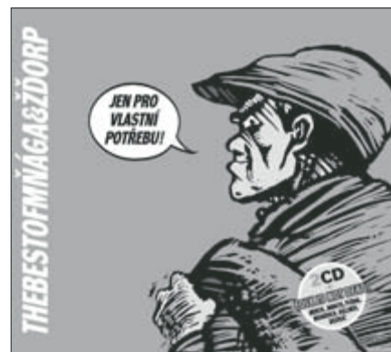
Titulní strana obalu 2CD Mňága a Žďorp: Jen pro vlastní potřebu (The Best of). Monitor-EMI, 2001.

V oboru užité grafiky je to trochu nadnesený pojem, ale i tak je to věčný problém. U studentů