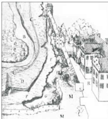
Ideální projekt Starého jezuitského konviktu v Olomouci (výřez z plánu olomouckých hradeb, po roce 1674).