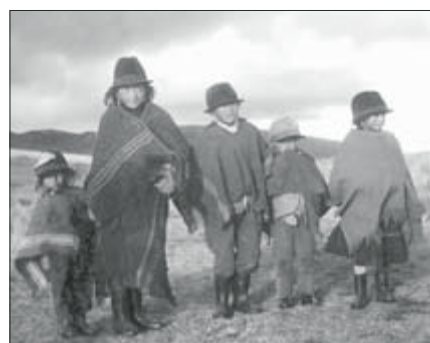
Děti z Río Blanco (Ekvádor), 1997

V případě Ostravy ve starých fotografiích bylo ve spolupráci s grafikem Zbyněkem Janáčkem, dříve studentem UP a současným děkanem PdF Ostravské univerzity, a s Janem Tejkalem, jinak heraldikem, použito sbírkového fondu rodiny Tejalů. Sbirka posloužila jako podklad pro obrazové sdělení o dávno zapomenuté podobě ostravské městské aglomerace, která nemusí být nutně vnímána pouze jako průmyslová. Naopak i ona má svá půvabná tajemství, stejně jako tajemným půvabem oplývá ženská portrétní fotografie.