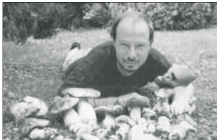
Zatíší houbařské (léto 2000)