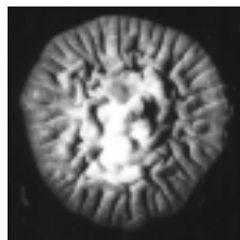
Původce kožní mykózy za života na kultivačním médiu.