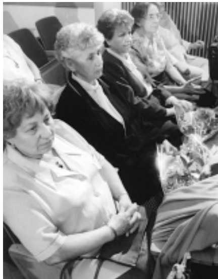
Ve středu 19. 5. 1999 byl slavnostně ukončen letošní ročník univerzity třetího věku UP.