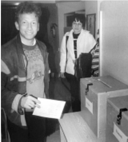
se vracíme k průběhu prvního kola voleb do Akademického senátu Lékařské fakulty UP, které se uskutečnily v prostorách Teoretických ústavů LF ve dnech 22. a 23. 3. 1999. Blíží informace o jejich výsledcích přineseme v příštím čísle Žurnálu UP.