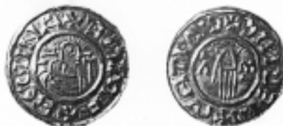
Denár choti Boleslava II. Emmy ražený v Mělníku