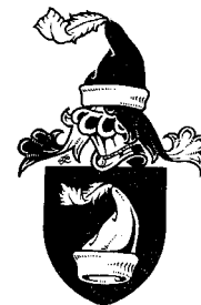
Erb rytířů Želeckých z Počenic podle olomouckého heraldika Jiřího Loudy