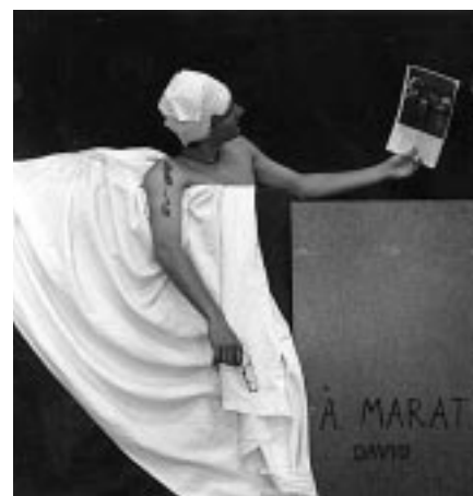
Zpracování tématu s názvem „Živé obrazy“.