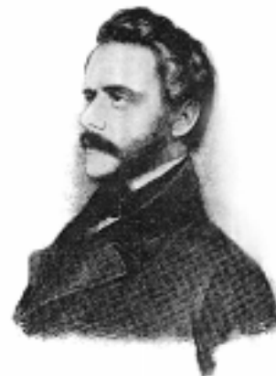
Leopold Lev hrabě z Thunu a Hohensteinu na dobové litografii