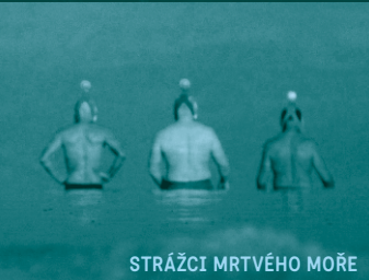
STRÁŽCI MRTVÉHO MOŘE