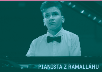
PIANISTA Z RAMALLÁHU